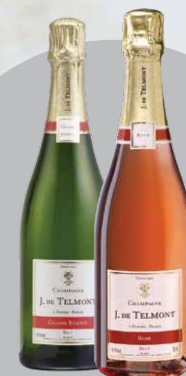
DUO CHAMPAGNE (3) J. DE TELMONT

PARRAINEZ UN PROCHE ET RECEVEZ UN CADEAU !