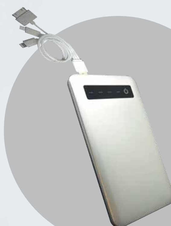
BATTERIE DE VOYAGE CURTI DESIGN