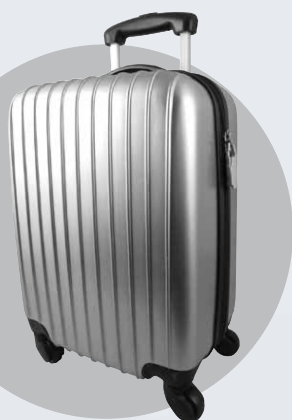
VALISE CABINE LOGOPROM