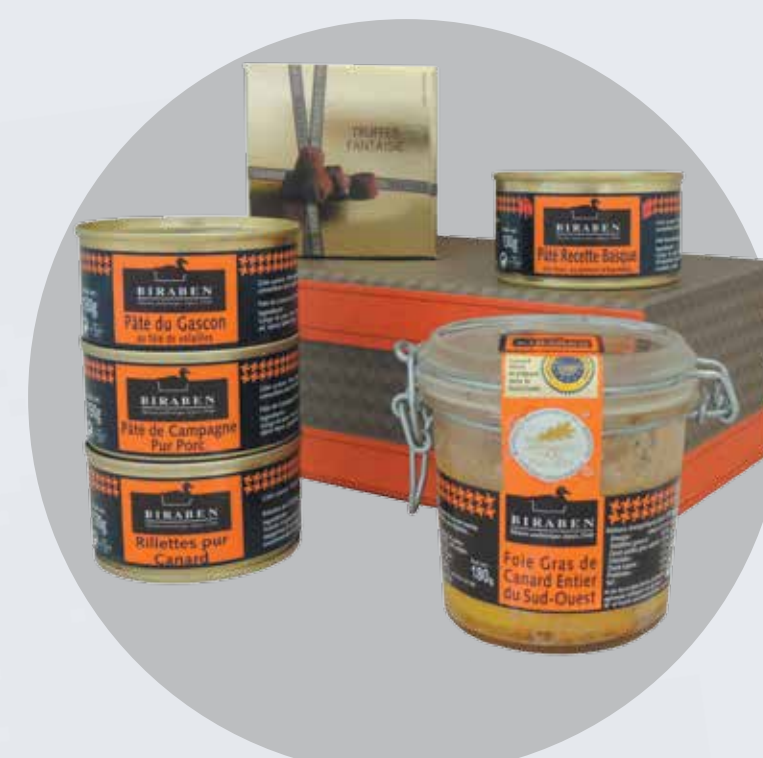
PANIER GOURMAND (2) BIRABEN